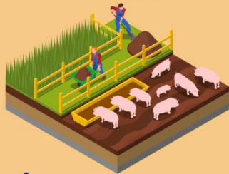
ที่ดินเกษตรกรรม มูลค่าประเมินเกิน 50 ล้านบาท