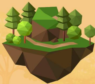
ที่ดินรกร้าง