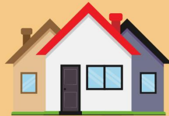
บ้านพักอาศัย (บ้านพักอาศัยหลัก มูลค่าประเมินเกิน 50 ล้านบาท /บ้านหลังอื่นๆ)